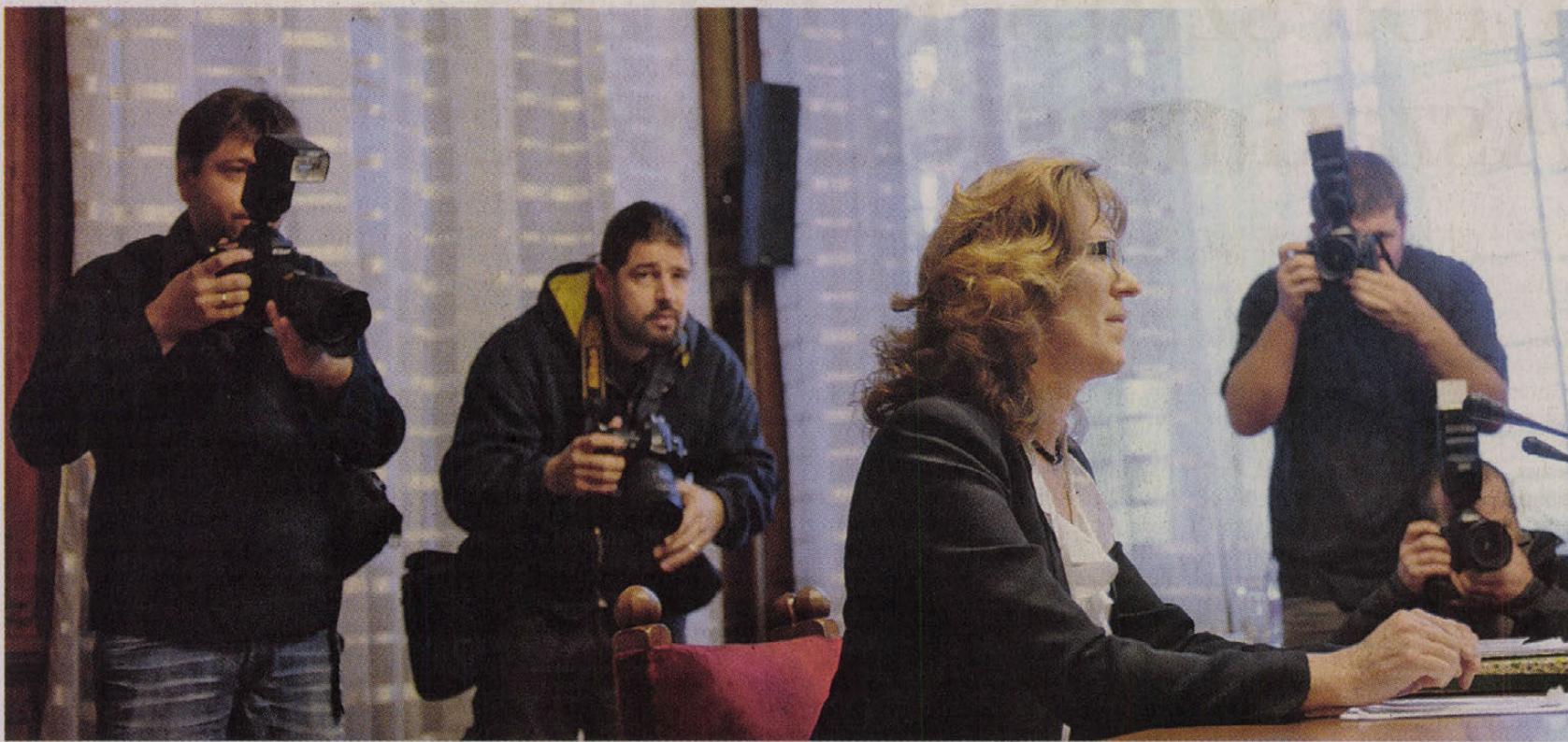
Handó Tünde, az Országos Bírói Hivatal elnöke a kamerák célkeresztjében. Túl sok hatalom van a kezében?